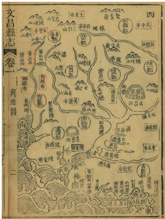
白延都、白延市(属多寻都)位置示意图

查阅资料发现，白延籍的国民党高官还真不少，粗略统计一下，将级军官就有近50名，其中