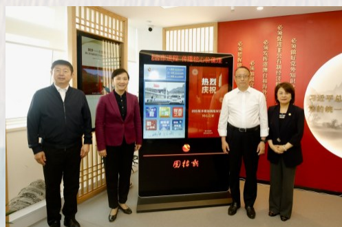
郑建邦为团结报电子阅报屏揭牌。