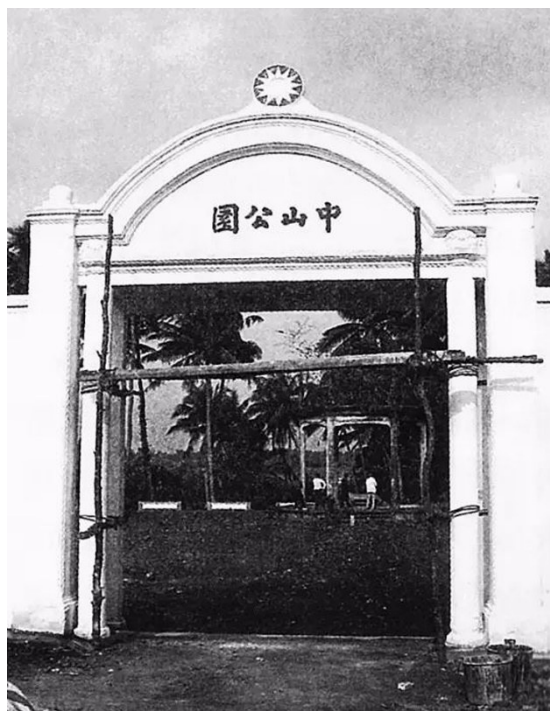
维修中的中山公园门楼(2010年)

历经时代变迁、岁月沧桑,各地的中山公园大多经受了战火和人为的破坏。很多公园在日寇的轰炸下毁于一旦;大量的文物古迹在某些历史事件中惨遭破坏和遗弃,公园内闻名遐迩的建筑景观消失,“中山元素”面目全非;随着城市化进程的推进,中山公园有的被改名,有的被辟为广场,有的悄然“失踪”,有的被城市建设用地挤占。截至2023年12月底,中国境内留存的中山