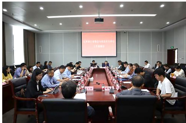
先进基层组织代表发言