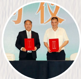
台湾中药商业同业公 会联合会与磐安县中 药材产业协会签约