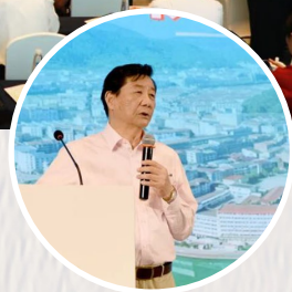
林国强院士作主旨报告