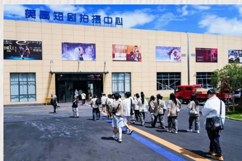
台湾街舞青年参观衢江美高短剧超级工厂