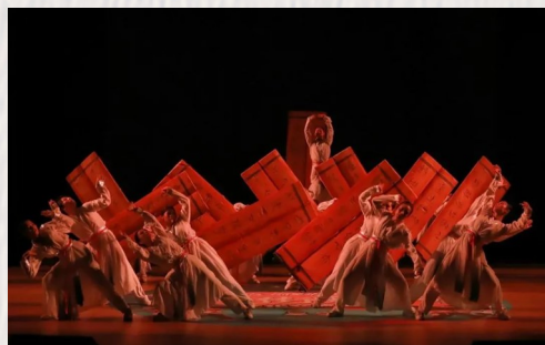
衢州街舞代表队齐舞作品《闻礼》